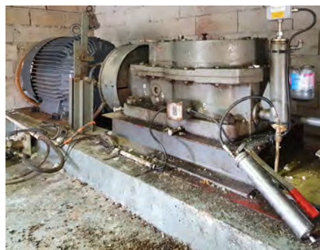
Génératrice et démultiplicateur

La micro-centrale hydroélectrique de Noria fonctionne ! Après plusieurs mois de panne (depuis janvier 2020), elle a été enfin réparée début novembre et tourne depuis à plein régime, en ces journées d'automne pluvieuses.